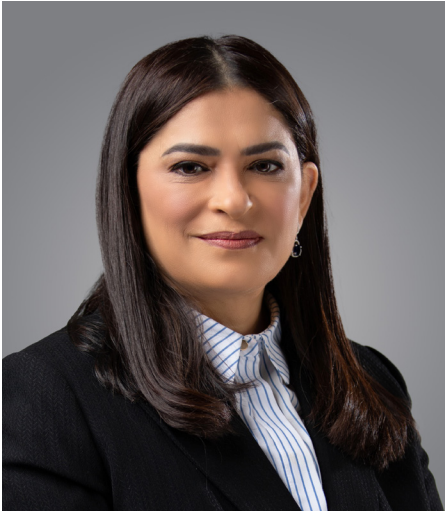
الدكتورة رائدة العلوي رئيس جمعية المهندسين البحرينية

المهندسين والمهندسات، وخلق صفوف مؤهلة لسوق العمل، بما يعزز تكافؤ الفرص والتوازن بين الجنسين في القطاع الهندسي في مملكة البحرين.