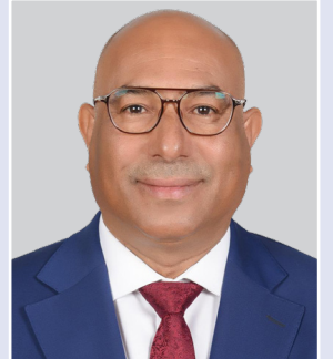
المهندس جواد الجبل نائب الرئيس