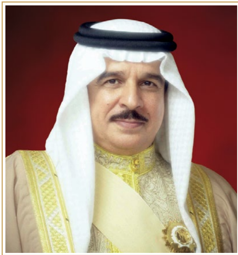
His Majesty King Hamad bin Isa Al Khalifa The King, Kingdom of Bahrain