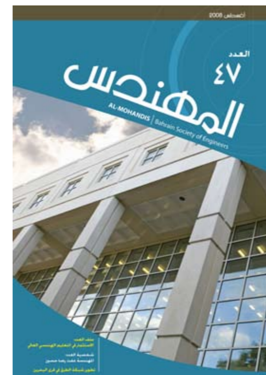
COVER ISSUE 47