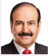
الدكتور عبدالحسين بن علي ميرزا